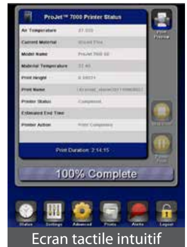
Ecran tactile intuitif

Les imprimantes crossover ProJet sont disponibles en deux formats, proposent trois configurations d'impression haute définition et un vaste choix de matériaux VisiJet® SL, procurant notamment endurance, flexibilité, couleur noire, transparence, résistance en température, résistance aux chocs, applications dentaires et de bijouterie.