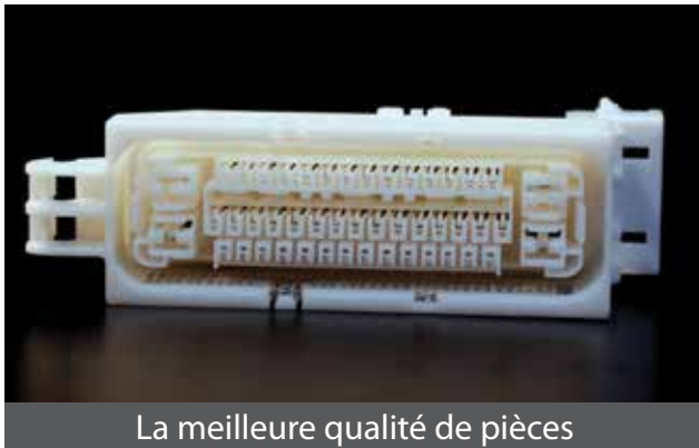
La meilleure qualité de pièces