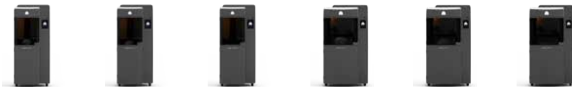
ProJet® 6000 SD ProJet® 6000 HD ProJet® 6000 MP ProJet® 7000 SD ProJet® 7000 HD ProJet® 7000 MP